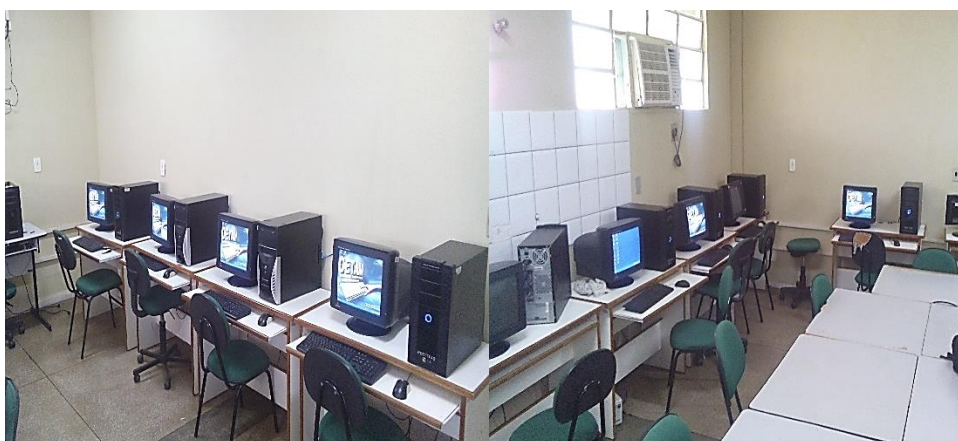
Figura 04: Laboratório de Informática da escola.

Para que o programa funcione corretamente é necessário que o computador siga as informações que são apresentadas pelo instalador do jogo eletrônico Cabanagem. Deve ter os seguintes requisitos básicos: