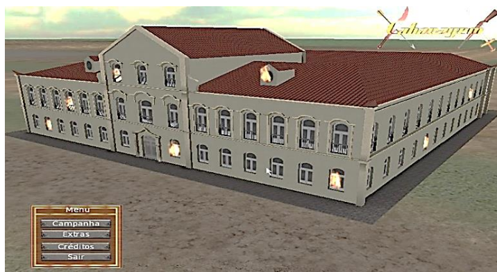
Figura 06: Imagem do jogo retratando palácio do governo.