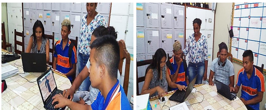
Figura 07: Sala dos professores, segunda tentativa de usar o jogo.

Nesta nova tentativa, buscamos verificar se em outro ambiente e com mais tempo para executar o jogo, os estudantes teriam condições de finalizar o mesmo e/ou se eles teriam mais tempo para verificar as características do jogo observando com clareza os seus acervos, históricos, narrativas, representações do ambiente do Grão-Pará e da característica da época.