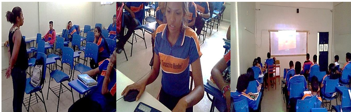
Figura 05: Laboratório de Informática da escola.

da turma poderia optar em ajudar o usuário piloto dando dicas de como poderia prosseguir no jogo. A pesquisa contou com a participação de 20 estudantes que estavam presentes no dia da aplicação da pesquisa (04 de maio de 2018).