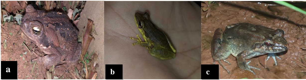
Figura 04. Espécies que mais se destacaram na pesquisa dentro das famílias.

Bufonidae, a) Rhinella marina ; Hylidae b) Scinax ruber ; Leptodactylidae c) Adenomera andreae .