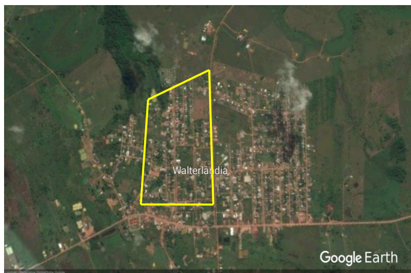
Figura 2: Bairro Piquiá com fragmento da área de pesquisa marcado em amarelo.