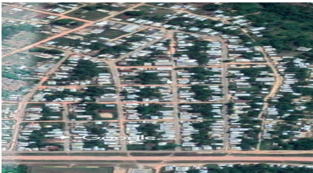
Figura 2: Bairro são Francisco