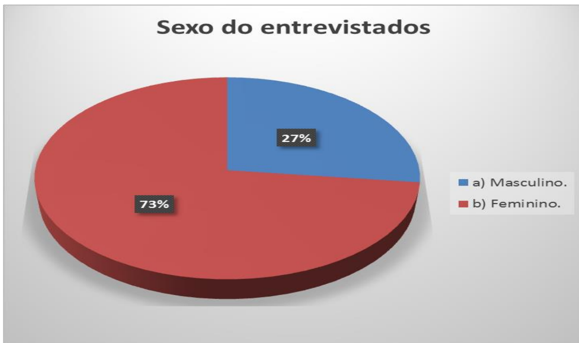
FIGURA 4: Sexo dos entrevistados.

A predominância do gênero feminino é justificada pelo fato das mulheres cuidar da casa e das crianças e são as principais responsáveis pelo tratamento caseiro das doenças mais simples através de plantas Vasconcelos (2001)