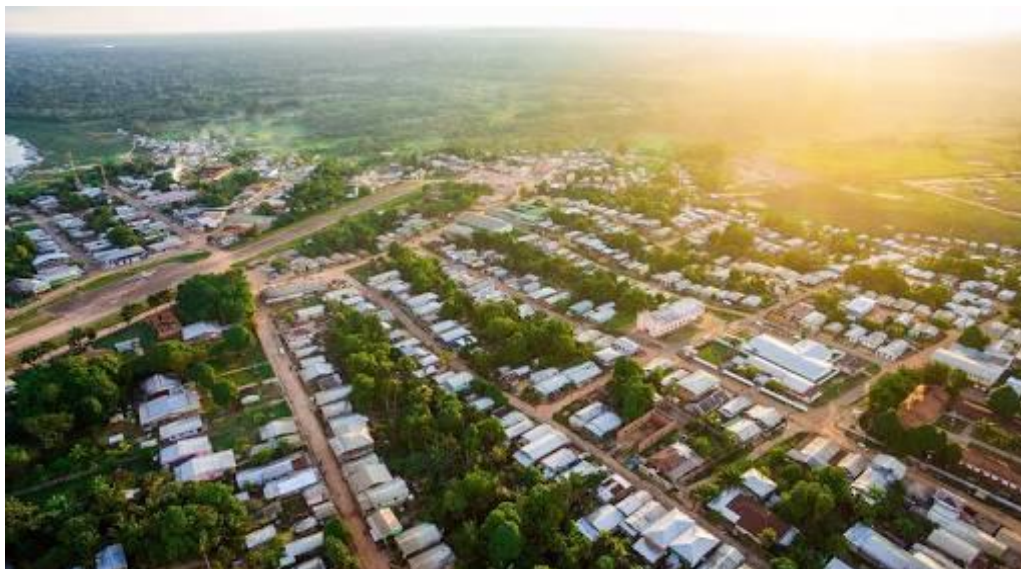
Figura 1: Imagem do município de Pauíni.

Residem no municipio cerca de 20 mil habitantes.