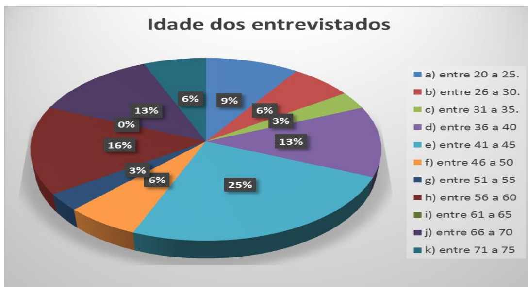
FIGURA 3: Porcentagem da idade dos entrevistados

Foram entrevistados 32 moradores do bairro São Francisco que possuem conhecimento das plantas medicinais durante a entrevista constatou-se q a maioria dos moradores residem no bairro há mais de 10 anos entre eles 25 do sexo feminino e 4 do sexo masculino a idade dos entrevistados varia entre 20 e 75anos.(Figura 3).