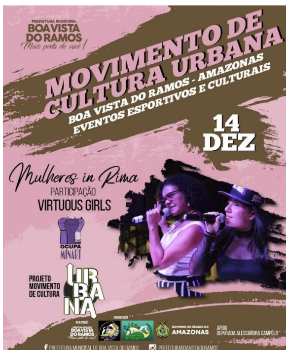
FIGURA 6 - Apresentação do Grupo Mulheres In Rima em parceria com o Virtuous Girls

Conforme a participante nos conta sobre o Mulheres In Rima, a expressão deles realmente vem através das músicas, quanto mais recebem retorno com o público, e a identificação de mulheres com as letras das músicas faz com que o grupo seja valorizado e siga repassando as mensagens e atuando no Hip Hop, de forma política e cultural na cena manauara.