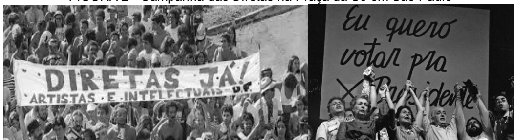
FIGURA 2 - Campanha das Diretas na Praça da Sé em São Paulo

Pecisamente nos anos de 1984 e 1985, o Brasil estava vivendo o último período da ditadura, e nestes dois anos foram iniciados uma série de movimentos para o processo de abertura política e redemocratização. Há vários fatos que simbolizam esta mudança política, dentre eles o que se destaca foi o movimento pelas “Diretas Já”. Bazaga (2013) afirma que o movimento foi nomeado assim como uma menção às eleições que iriam ocorrer em 1985 para a Presidência da República, e as pessoas que fizeram parte dos movimentos de oposição estavam lutando para exercer o direito de voto direto. Em 1983, através de um comício na cidade de Goiânia, ocorreu a primeira ação para o “voto direto”, e contou com um público de aproximadamente 5 mil pessoas.