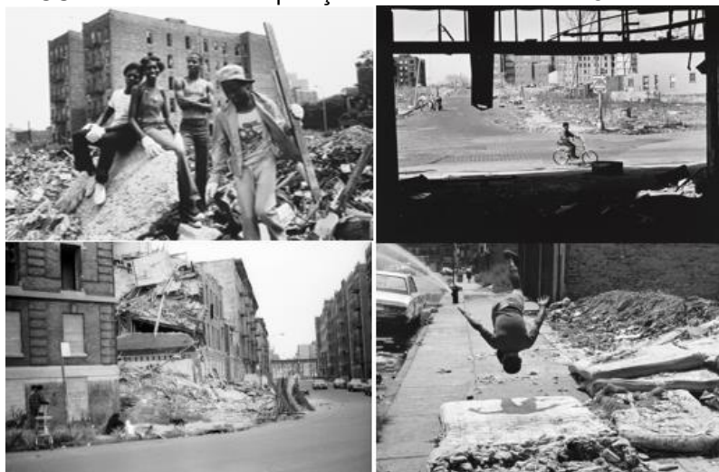
FIGURA 1 - Fotos da Exposição “In The South Bronx Of America”

A exposição In The South Bronx Of America traz uma reportagem visual com imagens do fotógrafo Mel Rosenthal sobre a miséria e as ruínas do bairro do Bronx na década de 1970, e que atualmente, apesar das melhorias, continua sendo um dos bairros com maior índice de violência de Nova York. Essa exposição esteve em 2016 no Museum Of The City Of New York, e essas imagens também tinha o objetivo de apresentar um testemunho de resistência da comunidade local.