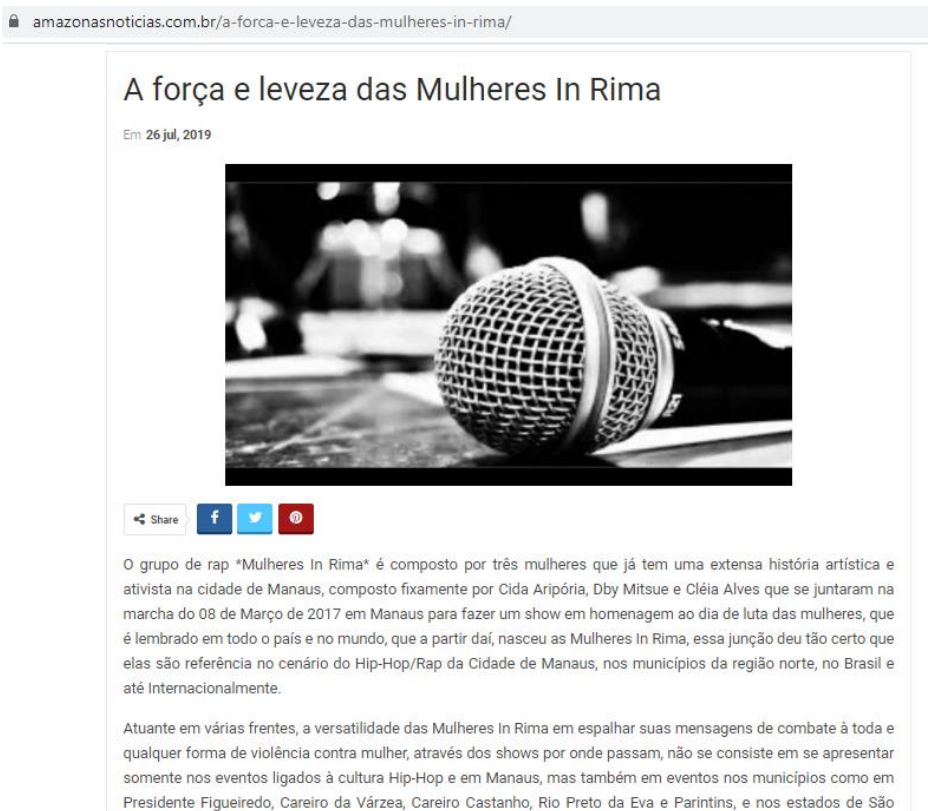
FIGURA 5 - Matéria sobre o grupo Mulheres In Rima e seu surgimento