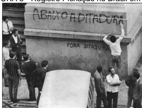
FIGURA 3 - Registro Pichação no Brasil em 1968

O Grafite e a pichação surgiram como uma forma de protesto e manifestação política, e tratando-se disso é possível relacionar com o período em que ele surgiu no Brasil, por volta da década de 1970 e 1980 em que o Grafite se manifestava como popular, além disso, o país estava propício a manifestações devido ao contexto histórico de divergências político-culturais da época. Segundo Papali et.al (2017), no blog Memórias da Ditadura foi encontrado um dos primeiros registros da pichação no Brasil, o que daria início a arte de rua brasileira com essa frase emblemática do contexto da época com “Abaixo a Ditadura”.