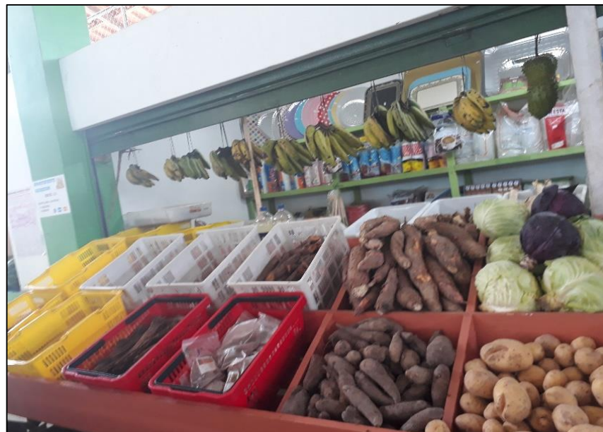
Figura 09: Frutas, verduras e outros produtos de um dos boxes da feira.