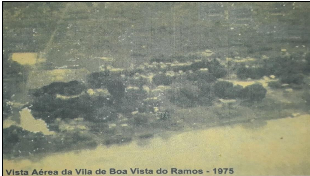
Figura 02: Vista Aérea da Vila de Boa Vista do Ramos – 1975.