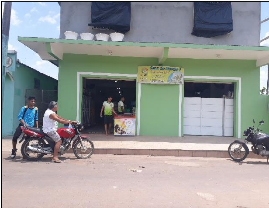
Figura 10: Casa do Rancho 1.