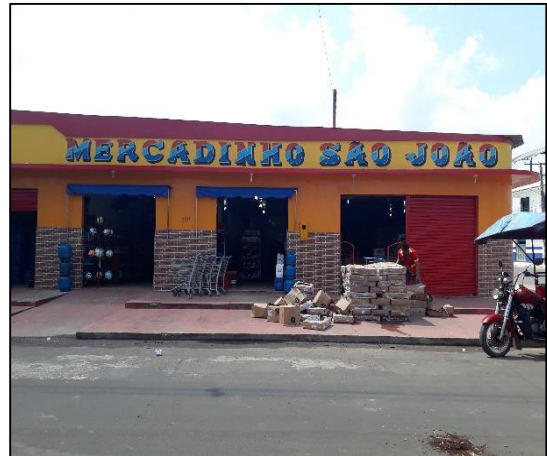
Figura 13: Mercadinho São João.