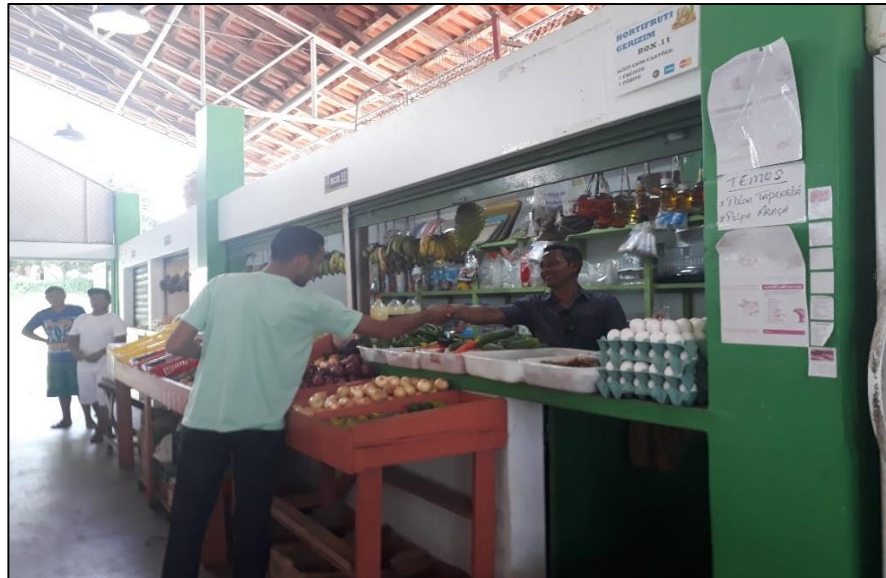
Figura 08: Boa-vistense fazendo suas compras na feira.