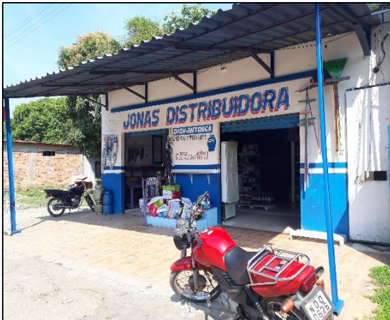
Figura 12: Jonas Distribuidora.