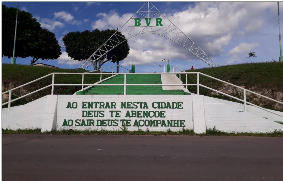
Figura 04: Entrada Principal da cidade de Boa Vista do Ramos.

Nas idas a campo foi possível observar a infraestrutura do município, onde se verificou que no Centro da cidade, concentram-se os principais comércios, agências bancárias (Bradesco, Caixa), praça da cidade (a única), igreja principal Nossa Sra. Aparecida, Escola Estadual Senador José Esteves, Casa Paroquial, entre outros. A área tem uma infraestrutura boa, possui asfaltamento e ruas limpas, podemos observar isso nas figuras 04 e 05 abaixo.