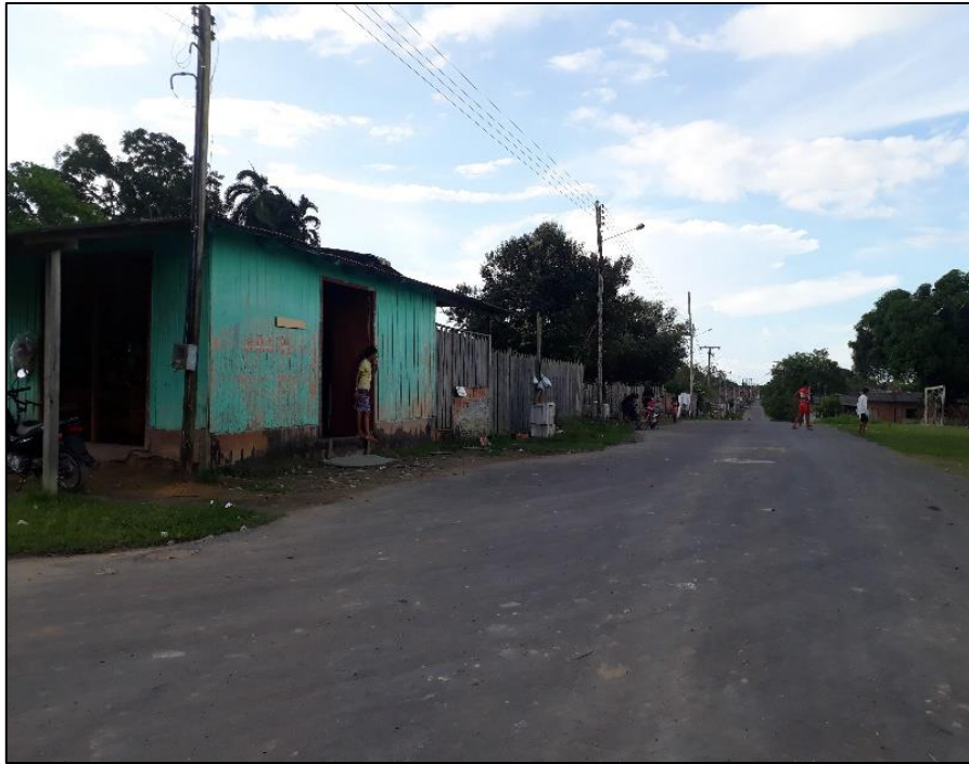
Figura 06: Bairro de Santa Luzia (Boiúna).