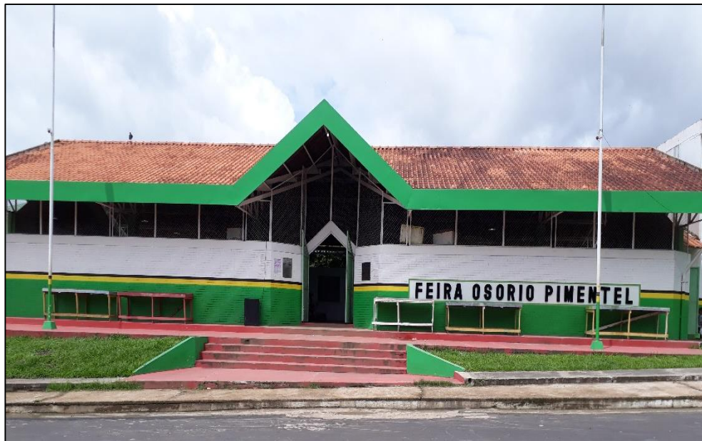
Figura 07: Feira municipal Osório Pimentel.

Ao falar em economia requer abordar a Feira Municipal (ver figura 07) e sua participação como um dos fatores que contribui para o movimento econômico da cidade, sendo que é um dos principais meios de subsídio da mesma. Assim como os estabelecimentos comerciais, a produção do mel (principal fonte de economia do município) e a própria agricultura familiar. Deste modo, falaremos um pouco sobre a feira municipal no processo de dinâmica e relações socioespaciais da pequena cidade.