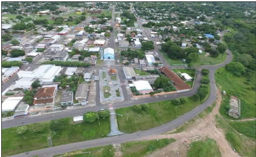
Figura 03: Vista aérea de Boa Vista do Ramos – AM.