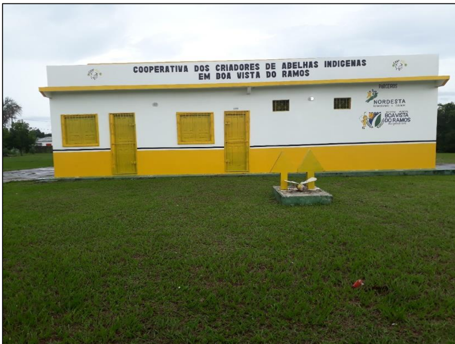
Figura 15: COOPMEL em Boa Vista do Ramos.

O município de Boa vista do Ramos também conta com a produção do mel, que de acordo com a Secretaria de produção rural, “apresenta-se como o maior produtor de mel de abelhas sem ferrão (meliponicultura) do Brasil”. Esta produção é organizada pela cooperativa de criadores de abelhas indígenas denominada COOPMEL que localiza-se na própria cidade. (Ver figura 15).