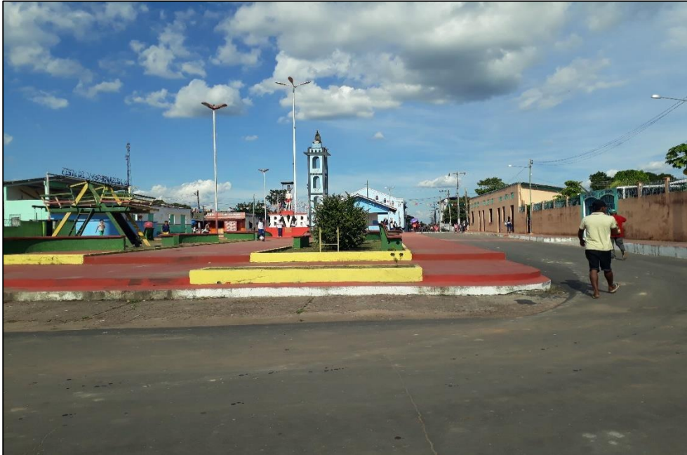
Figura 05: Praça de São Sebastião.