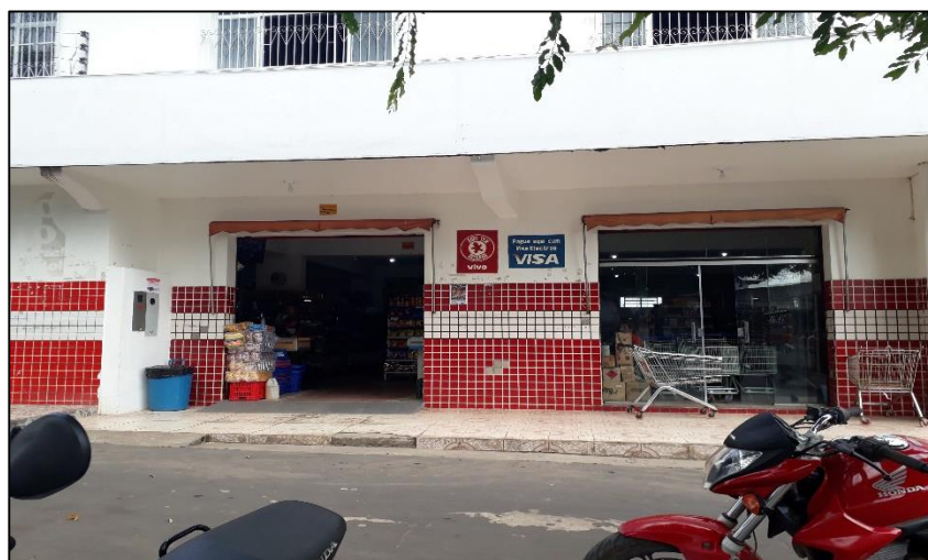
Figura 14: Supermercado Dico Dácio.