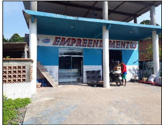
Figura 11: Empreendimentos.