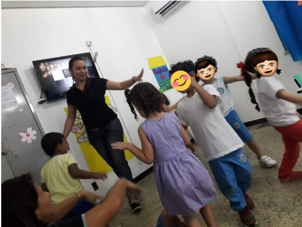
Figura 3: Atividade realizada no segundo dia de intervenção