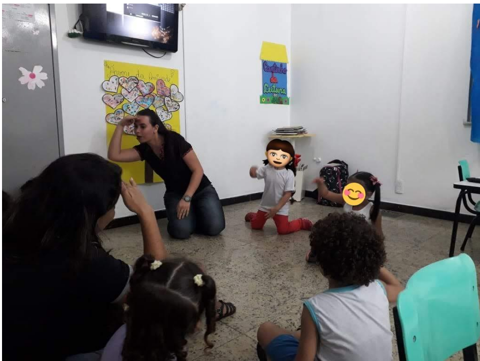
Figura 2: Atividade realiza no primeiro dia de intervenção