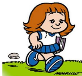
Figura 3: Tati indo para a escola