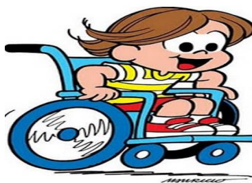
Figura 2- Luca brincando de corrida