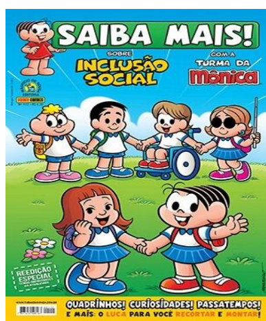
Figura 1: Capa de um gibi de edição especial

Com isso, é possível afirmar que ler é viver, que vai além de decodificar palavras ou atribuir significados. Ou seja, o ato da leitura é o que nos permite sermos quem verdadeiramente somos, é o que transforma a realidade de qualquer ser humano por meio da educação, é o que une países, promove alianças e integra o ser humano na sociedade.