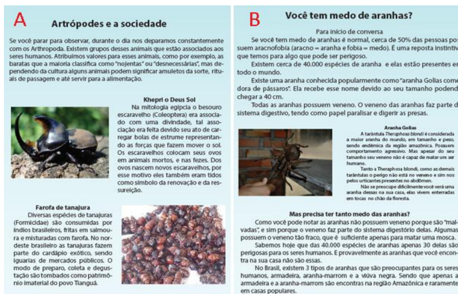
Figura 2: A) Seção demonstrando as diferentes construções culturais sobre os artrópodes; B) Seção demonstrando a contextualização da visão negativa sobre as aranhas

desse distanciamento, as atitudes negativas foram generalizadas para todos os representantes do grupo (HOYT & SCHLTZ, 1999).