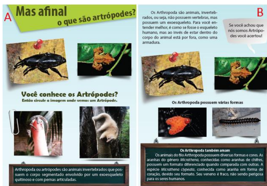
Figura 1: A) Página inicial introduzindo aos artrópodes; B) Modelo de formulação do conteúdo onde o aluno por tentativa e erro – Fonte: Nascimento, 2015

À vista disso a cartilha é montada visando as novas tendências educacionais priorizando a formulação de conceitos e a não memorização (Fig. 1). Quando relacionamos o conteúdo dos livros didáticos com as novas propostas da educação, somos capazes de evidenciar problemas que influenciam no processo de ensino. Os livros didáticos, na sua formulação, condicionam os alunos a uma prática de memorização. No trabalho de VASCONCELOS & SOUTO (2003), é descrito que os livros trazem conceitos gerais sobre os artrópodes, entretanto não a uma interligação entre os conceitos, desta forma, quando o autor pede para os alunos conceituarem um artrópode, eles reproduzem os termos que definem artrópode, mas não conseguem reorganizar seu conhecimento e propor uma definição para Artrópode.