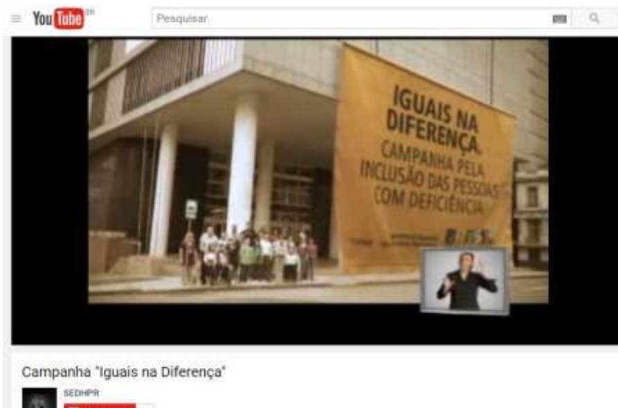
Figura 14: Campanha do Governo Federal em prol da inclusão das pessoas com deficiência.

Fonte: https://www.youtube.com/watch?v=tsfaaHrw0Wc