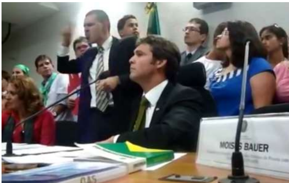
Figura 13: Imagem do presidente do CONADE, Moisés Bauer, discursando em audiência com o senador Lindbergh Farias (PT/RJ).