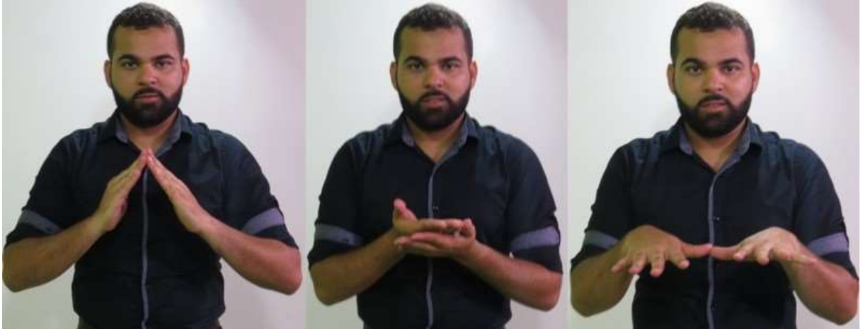
Figura 6: Sinal para se referir à escola inclusiva ou ensino regular (composição dos sinais CASA + ESTUDAR + INCLUSÃO)