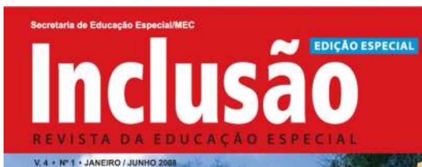
Figura 11: Imagem da capa da Revista Inclusão (2008)