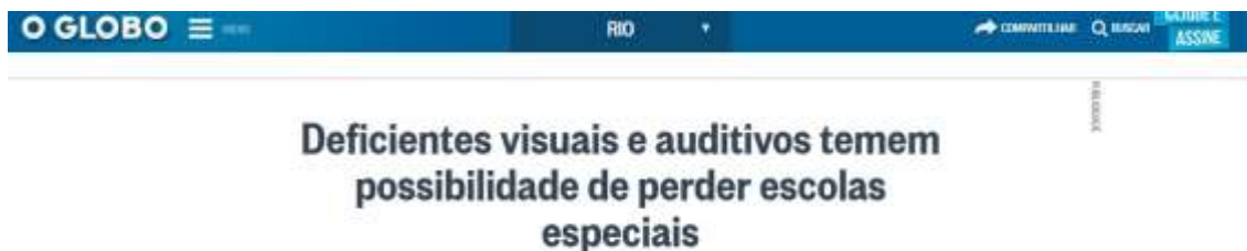
Imagem 6: figura da manchete da reportagem do jornal O Globo sobre os impactos das políticas inclusivas para cegos e surdos.