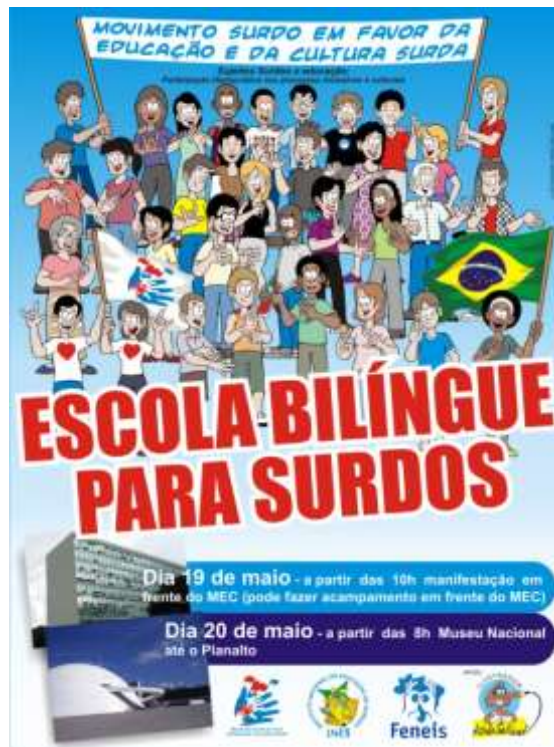
Figura 4: Cartaz com informações e convite para participação do movimento em favor da educação bilíngue para surdos.