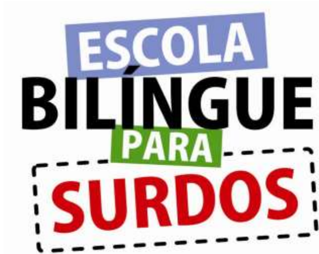
Figura 5: Símbolo do movimento em favor da educação bilíngue para surdos.