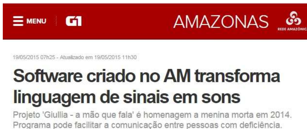
Figura 17: Manchete da reportagem sobre um software tradutor de LIBRAS – Português desenvolvido no Amazonas.