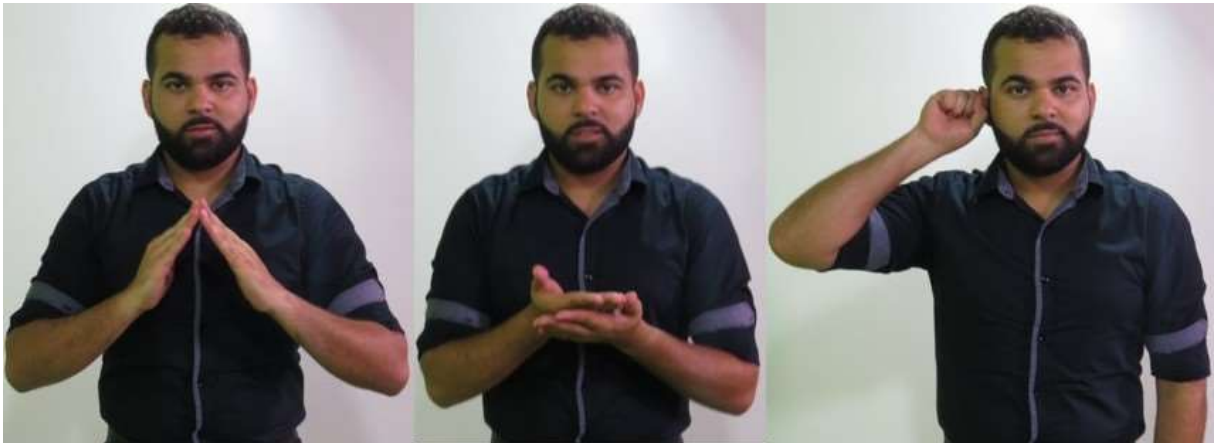
Figura 7: Sinal para se referir à escola inclusiva ou ensino regular (composição dos sinais CASA + ESTUDAR + OUVINTE)