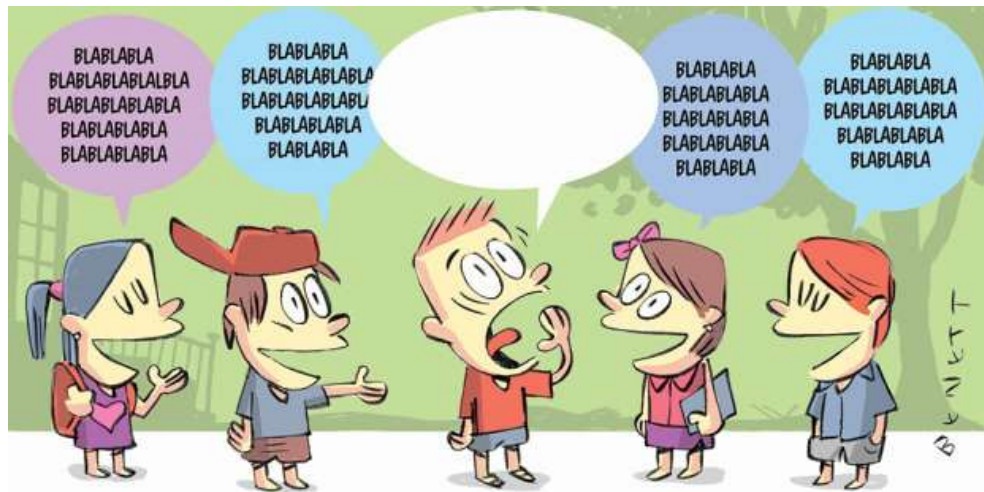
Figura 9: Charge que representa a falta de interação do surdo com os ouvintes no ensino regular

Nessa declaração, pode-se perceber que o fenômeno da segregação se faz presente na escola inclusiva porque há um desconhecimento dos responsáveis por elaborar e implementar essas políticas a respeito do universo surdo e o que pode ser mais satisfatório para essa comunidade. Segundo esse discurso, na escola inclusiva há um isolamento do sujeito surdo, conforme ilustra a charge a seguir: