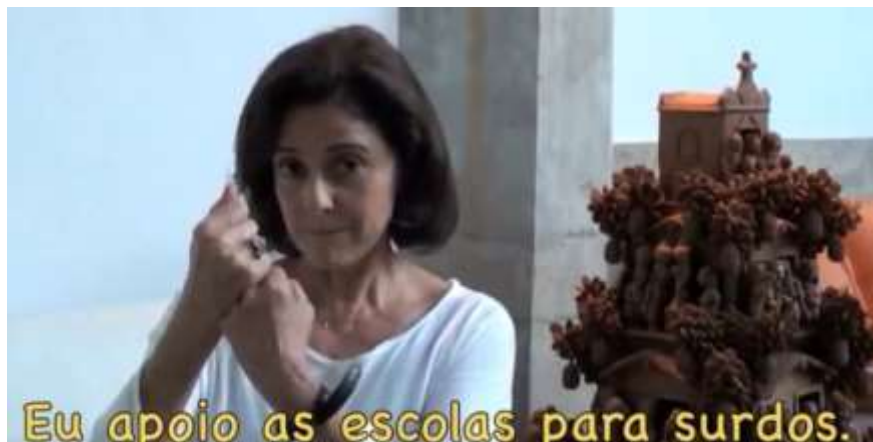
Figura 12: A atriz Marieta Severo endossando o movimento dos surdos em favor da educação bilíngue.