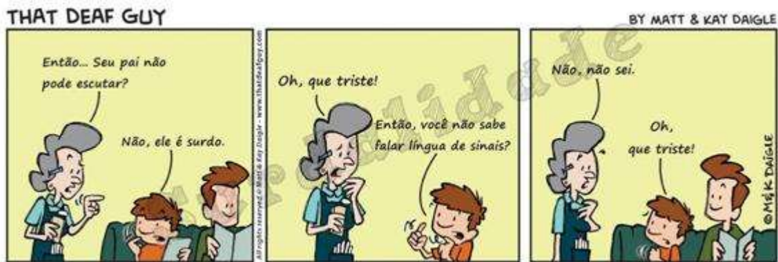
Figura 10: Charge produzida pelos cartunistas Matt e Kay Daigle.

A formação discursiva da diferença atribui uma elevada valorização de uma cultura surda como forma de significação social e aceitação dessa condição sem um sentimento estereotipado sobre si mesmo, o qual é atravessado pelo discurso da deficiência. Pode-se perceber esse discurso na charge abaixo: