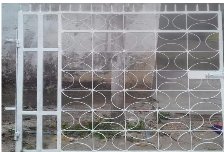
Fotografia 2 – Grade construída com a ajuda do gabarito

O uso do gabarito assegura que as semicircunferências produzidas para o desenho da grade tenham medidas iguais, isto é, o mesmo raio, diâmetro e comprimento. Na Fotografia abaixo podemos visualizar a grade já pronta cujo traçado ornamental foi produzido pelo gabarito.