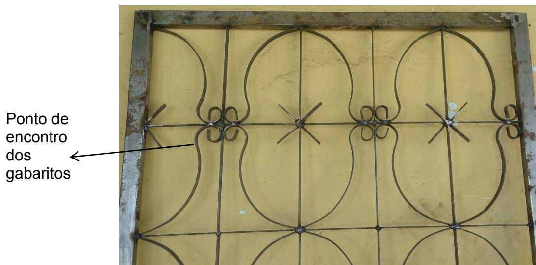
Fotografia 4 – Grade construída com a combinação dos gabaritos.