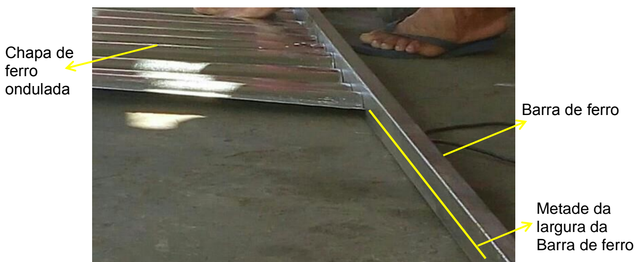
Fotografia 4 – Situação problema.

Uma das situações problemas enfrentadas pelo senhor Bentes que observamos durante o desenvolvimento da pesquisa se refere à necessidade de soldar uma chapa de ferro ondulada na metade da largura de uma barra de ferro, como podemos visualizar na fotografia 4.