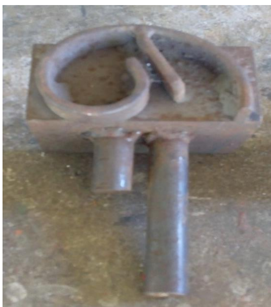
Fotografia 3 – Gabarito de curva.

Na fotografia 3, podemos visualizar mais um gabarito construído pelo senhor Bentes para ser utilizado no desenho de uma grade.