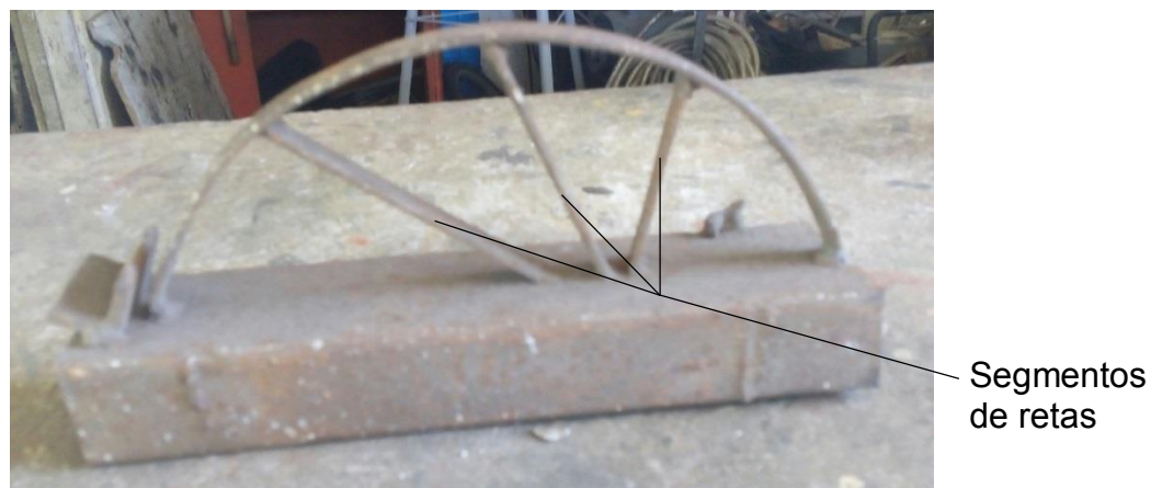
Fotografia 1 – Gabarito de semicircunferência