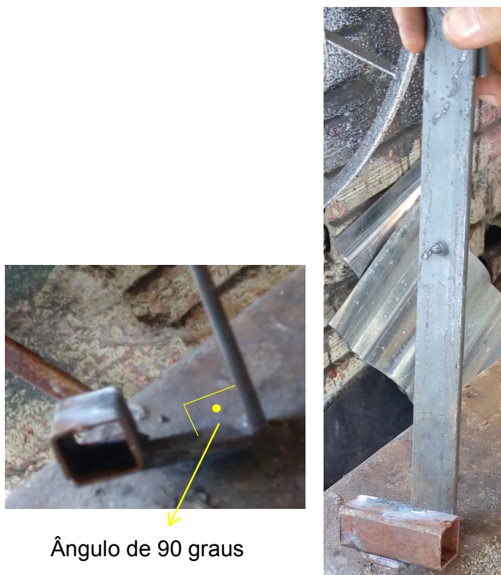
Fotografia 5 – O gabarito construído.

Na fotografia 5, podemos visualizar o gabarito construído pelo senhor Bentes para resolver a situação-problema.